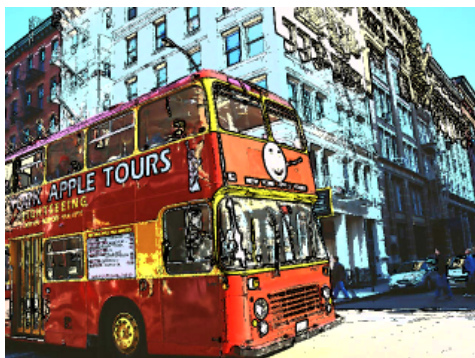
Morpho Effect Library (コミック)