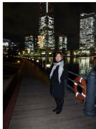
夜景も被写体もキレイに撮影