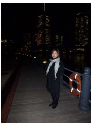
フラッシュあり(夜景が写らない)

フラッシュを発光させ人物像を救い、発光後もシャッターを開放状態で露光し続ける事で背景を救う撮影方法。スローシャッターのため三脚が必須となる。