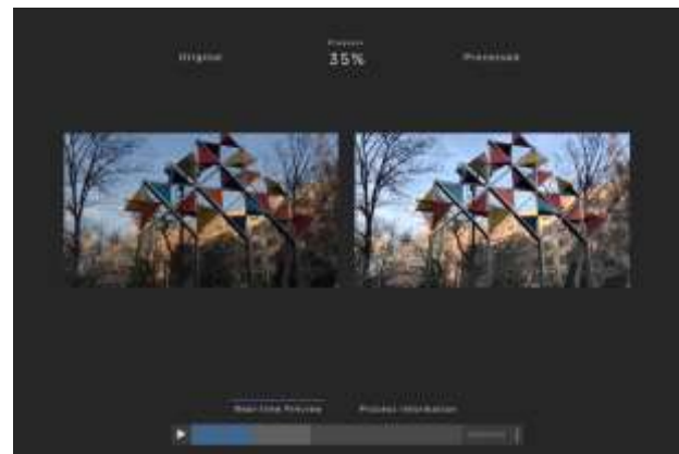
映像処理プレビュー（前後）