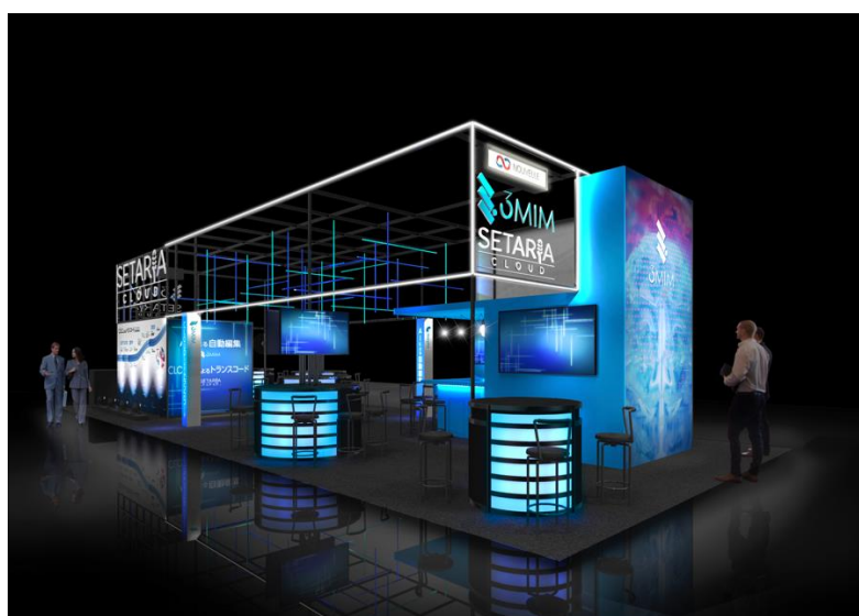
出展ブースイメージ